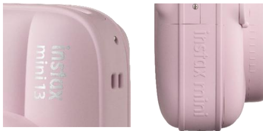
相機正面及側面均印有標誌