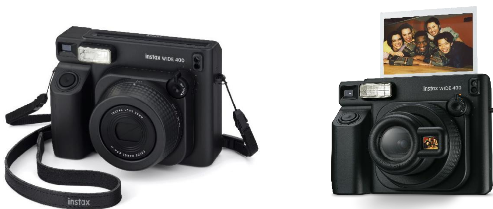
instax WIDE 400™ 「極致黑」

FUJIFILM 將繼續擴展 instax™ 即影即有系列，讓大眾盡情享受即拍即印的樂趣。