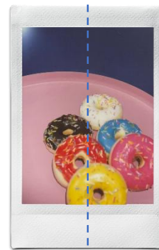
實際拍攝的中心點會較取景框的視野偏右