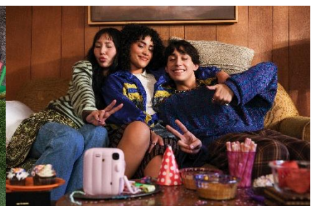
使用自拍計時器自拍的示範