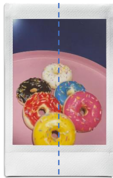
無需調整取景框的中心點