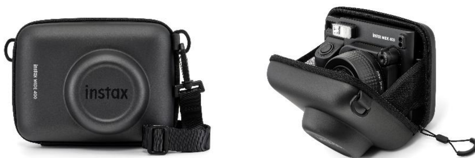
instax WIDE 400™ 「極致黑」專用相機保護套