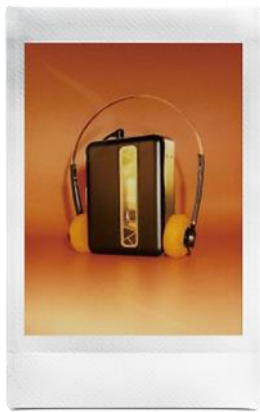
無需調整取景框所見的中心點