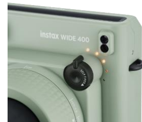
槓桿操作自拍定時器