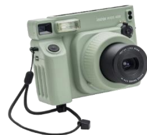
附帶相機角度調節配件