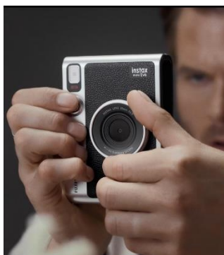
轉動轉環切換鏡頭效果

mini Evo 是首次採用打印桿、菲林轉盤、鏡頭轉環和冷靴座的即影即有相機，造型獨特之餘亦保留真實無反相機的手動樂趣。菲林轉盤和鏡頭轉環讓用家任意切換拍攝效果，通過機背 3 吋 LCD 屏幕取景並預覽各種拍攝效果，亦可透過屏幕挑選列印的照片。打印桿模擬菲林機的過片桿設計，撥動時會發出清脆利落的齒輪聲音，勾起昔日攝影情懷。冷靴座亦可安裝外置補光燈，為畫面營造出層次豐富的光與影，亦令相機整體造型更復古。