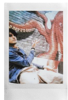
<鏡頭效果 [正常] × 菲林效果 [蒼白]>