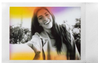
<鏡頭效果 [漏光] × 菲林效果 [黑白]>

mini Evo 配備 10 種不同的鏡頭效果包括柔焦效果、漏光效果等；再加上 10 種不同的菲林效果，例如黑白色調及復古色調，用家可隨著喜好組合兩種特效，透過 100 種拍攝效果表達不同心情與個性。