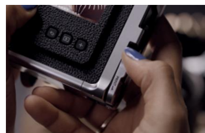
拉下打印桿列印照片