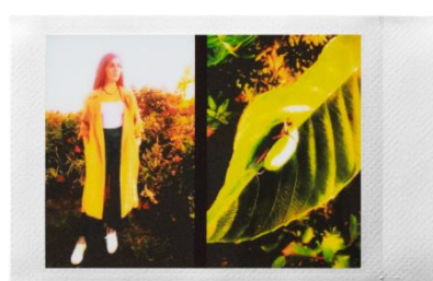
<鏡頭效果 [半格] × 菲林效果 [生動]>